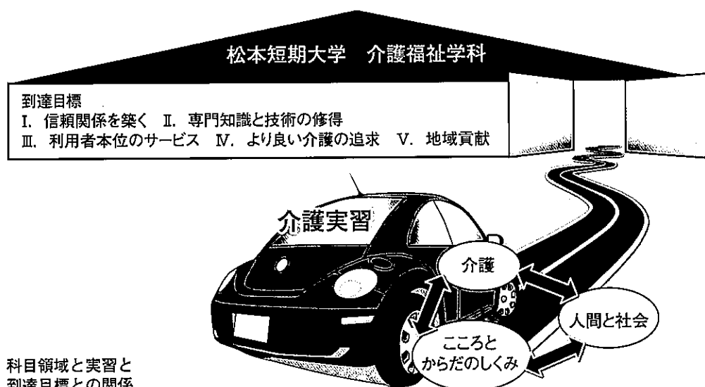
図4 科目領域と実習と到達目標との関係

そこで、これらの関係を図示すると車に例えることができる。「人間と社会」と「こころとからだのしくみ」は車の車輪にあたり車体を支えるものとなる。車の車体は「介護」となり、専門的知識・技術を兼ね備えてくれば上等な車体にも変化できる。車体の中にあるものが「介護実習」である。「介護実習」は車の内装ともなり、人を安全に適切に目標に近づけていくことになる。(図4参照)